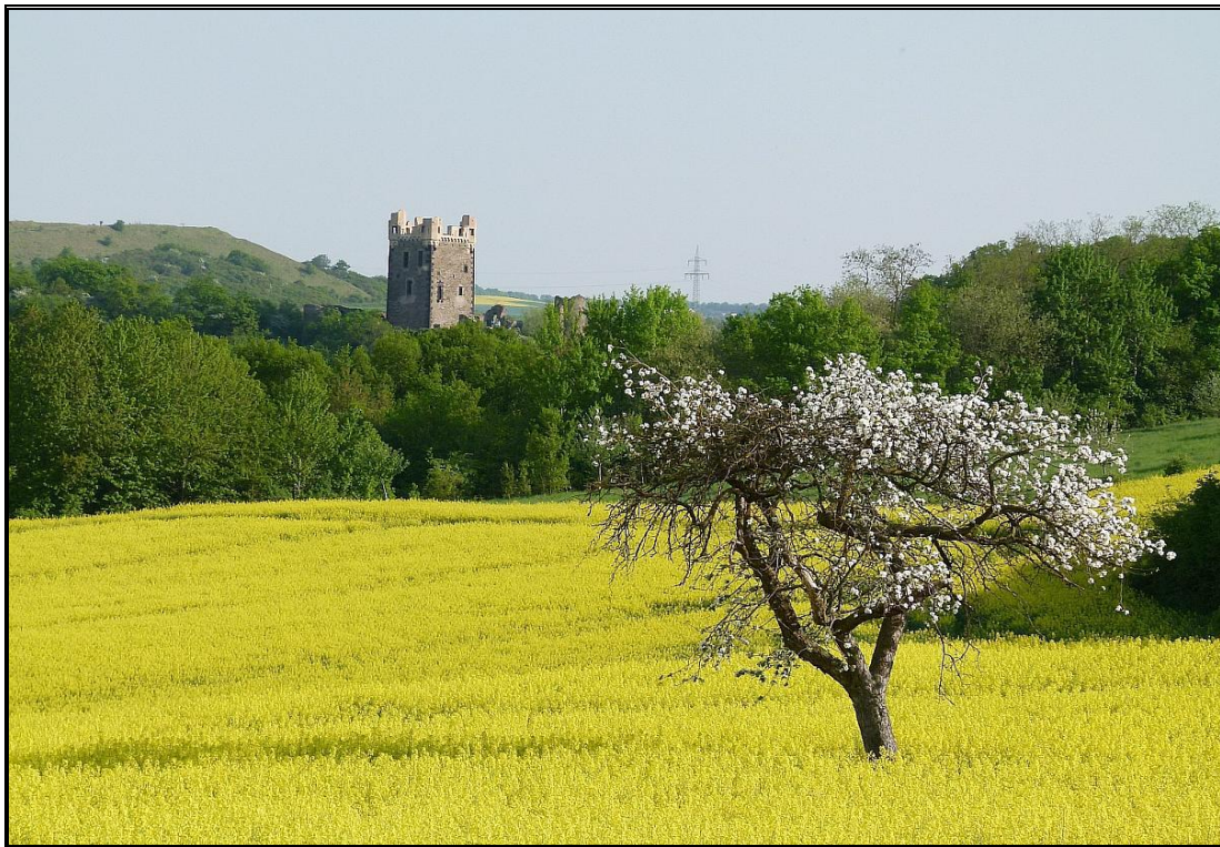
Blick aus Richtung Plaidt auf die „Burg Wernerseck“

(Qu. V. Hontheim, Historia Trevirensis diplomatic; Handschriftliche Quelle: Staatsarchiv Düsseldorf; Ansichten: Museum Köln und Denkmalarhiv Bonn)