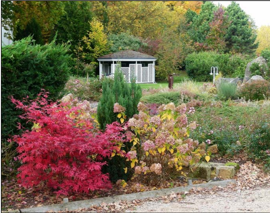
Herbst im Park am Seehotel in Maria Laach